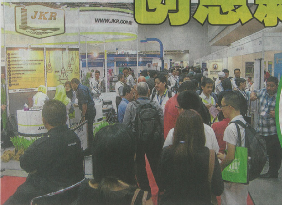
虽然是工作日,但这项备受瞩目的科技展,依然吸引无数人观展。

这是台湾元大教育机构发明班学生探讨有关食品安全,而发明出“有机栽种箱”,第一层用以种植,其余则养殖蚯蚓,因其粪便是很好的有机肥,每层有陶瓷条管连接至蓄水空间,水份将通过陶瓷条管输送至蚯蚓及蔬菜。这个栽种箱环保又实用,住在公寓者可自种一些蔬果了。